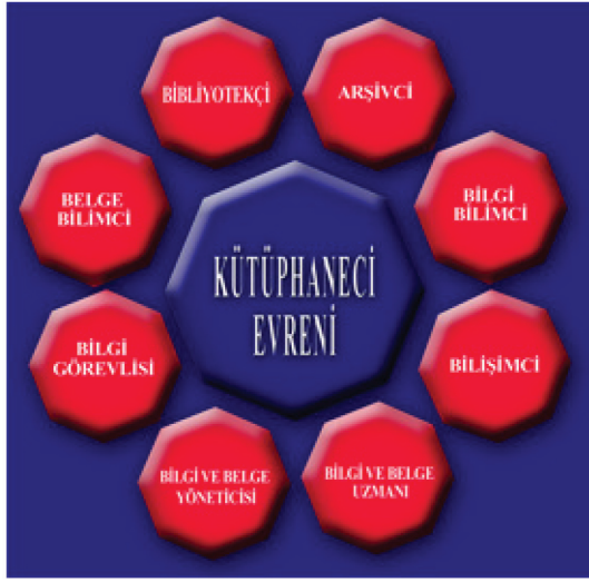
(Şekil 1): Kütüphaneci Evreni

Arapça'da kitaplar manasına gelen "kütüb" ile Farsça'da ev manasına gelen "hane" sözcüğünün bileşiminden oluşan "kütüphane" terimi, mesleği gerçekleştiren kişi anlamında "kütüphaneci" terimi ile Türkçemize kazandırılmış bir sözcüktür. Bugün yerli ve yabancı kelimelerden oluşan birçok sözcük bu mesleki terimle aynı anlamdadır.