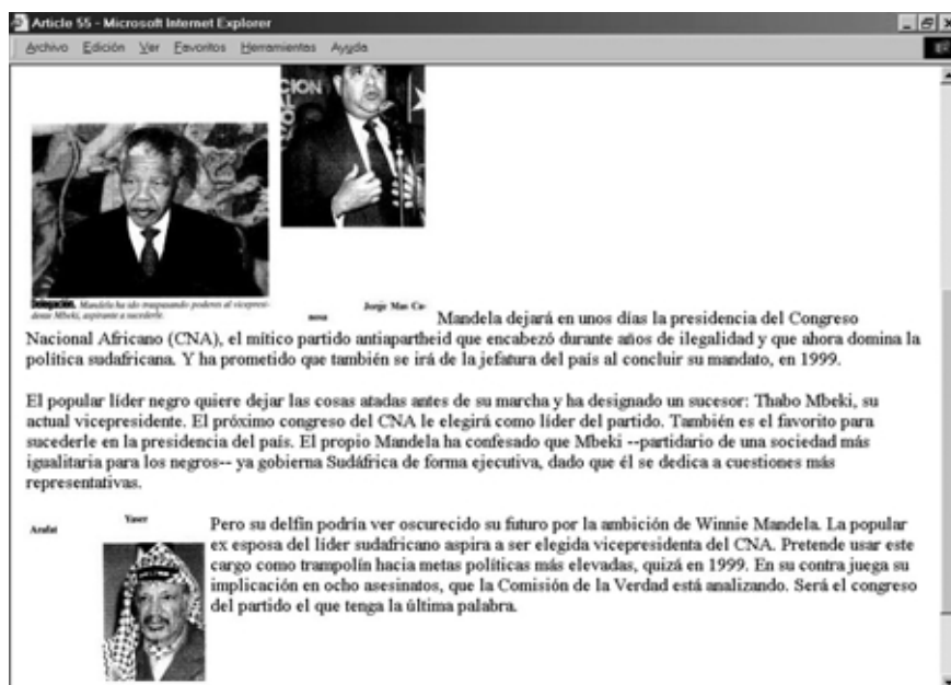
Ejemplo de noticia