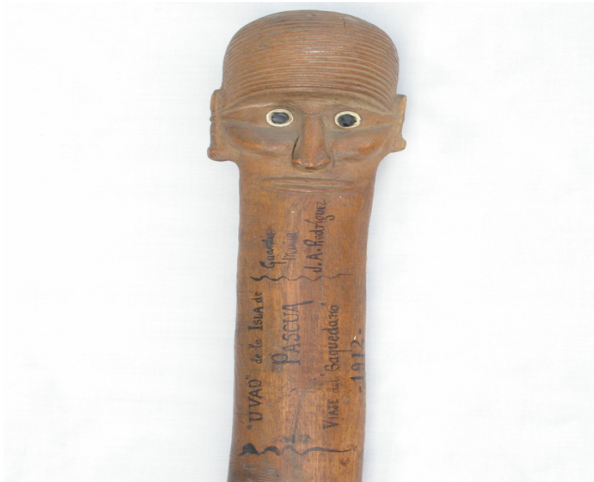
Paoa, maza de guerra

Este trabajo bibliográfico quiere ser una invitación, una puerta abierta en los registros del conocimiento, que facilite el acceso al misterio de la soledad oceánica que explica la magnificencia de los moai y el genio inspirador de sus escultores.