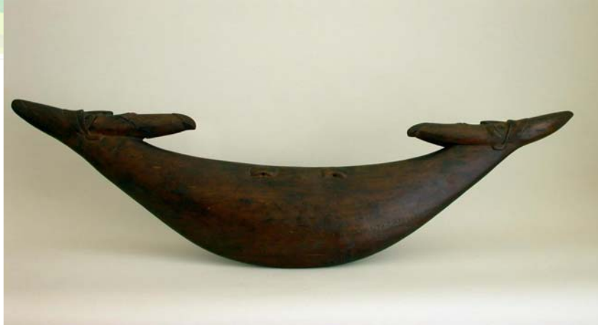
Reimiro, pectoral ceremonial