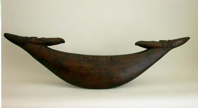
Reimiro, pectoral ceremonial