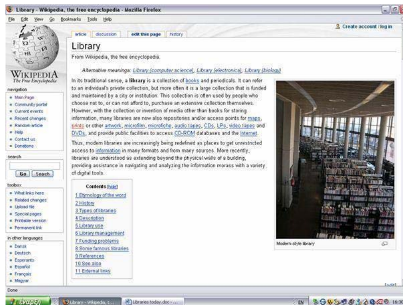
Εικόνα 3: Προέρχεται από την Wikipedia, πρόκειται για το λήμμα του όρου «βιβλιοθήκη»

εντοπίζονται γρήγορα, σε λιγότερο από δύο λεπτά, από εθελοντές «επιμελητές - εκδότες», κι έτσι ενδεχομένως να μην προλάβει να τα δει κανείς.