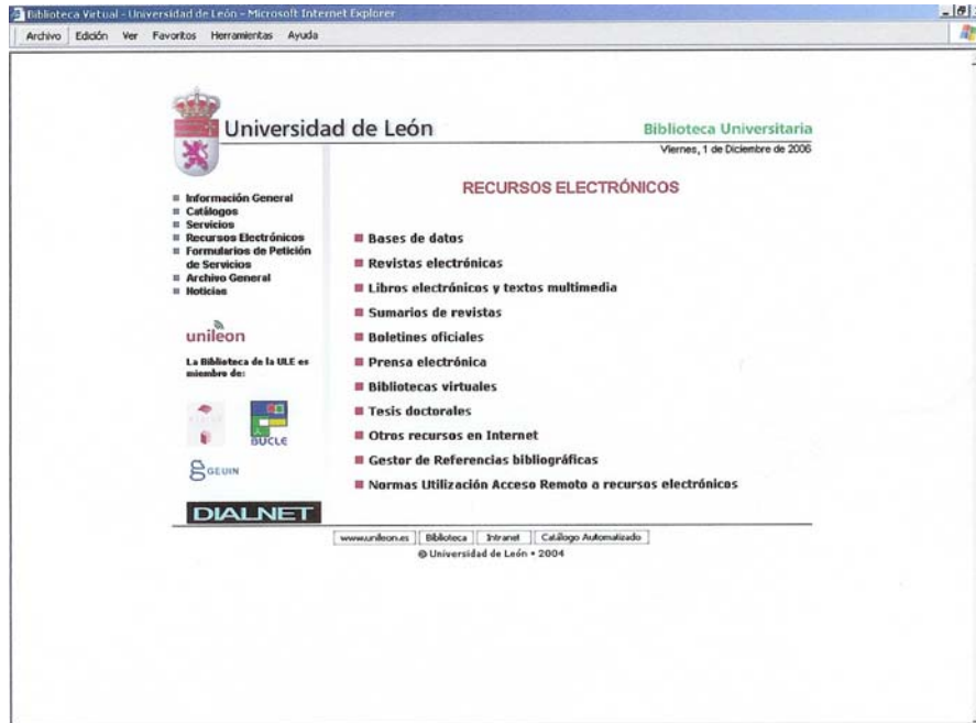
Fig. 1: distribución del contenido en el website antiguo

Como se puede observar en la figura 2 el Motor Avanzado tiene una estructura clara y sencilla, por lo que su fácil manejo va a estar asegurado. Tanto es así, que la opción de búsqueda es a texto libre, es decir, el usuario puede introducir un título, descriptor, palabra clave, etc. en una caja vacía y recuperar la información relevante a su pregunta. Permite además perfilar esa búsqueda, aplicando criterios concretos como: Tipo de recurso, Materia, Proveedor, Submateria y Tipo de acceso.