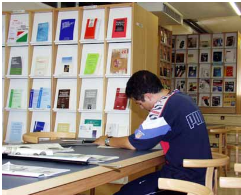
Biblioteca General del Campus de Cuenca. Hemeroteca.