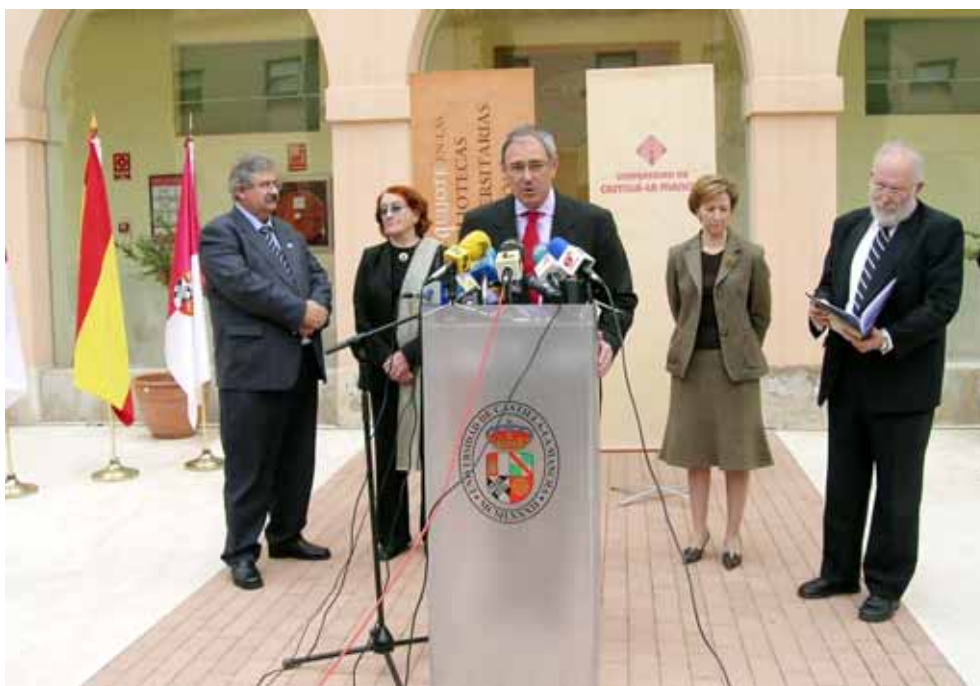
Inauguración de la exposición “El Quijote en las Bibliotecas Universitarias Españolas”

Además, la Biblioteca de la UCLM ha seguido aportando sus registros al catálogo en línea de REBIUN (Red de Bibliotecas Universitarias Españolas) y al catálogo en línea RUECA (Red de Universidades Españolas con Catálogos Absys). El primero de ellos constituye el catálogo colectivo más importante de España, con el registro bibliográfico de más de 32.000.000 de volúmenes.