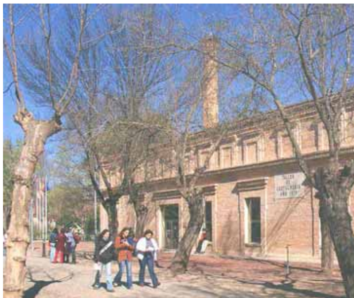
Biblioteca de la Fábrica de Armas. Toledo.

En este sentido destacan, por su novedad, la Biblioteca del Centro de Estudios Universitarios de Puertollano, la ampliación y remodelación de la Biblioteca General del Campus de Cuenca, y la muy reciente de la Biblioteca General de Toledo, que creció en el año 2005 gracias al espacio ganado con el edificio de Madre de Dios, anexo al de San Pedro Mártir.