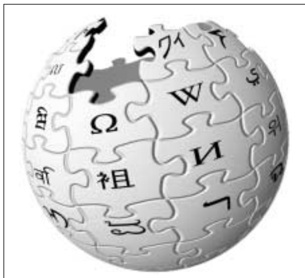
Símbolo de Wikipedia.

"Esta obra monumental respira la misma orientación que la propia internet: distribuir, compartir y cooperar libremente"