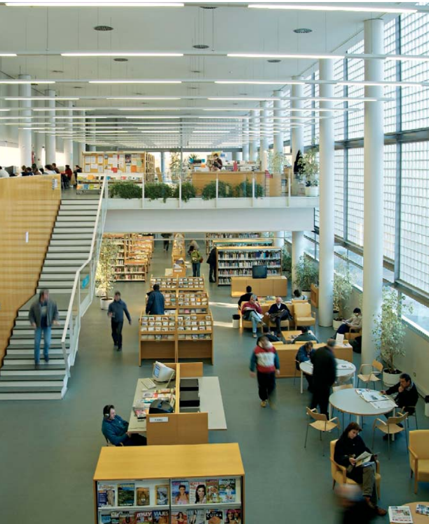
Biblioteca de Viladecans. Servei de Biblioteques de la Diputació de Barcelona

prenderle la brevedad de su articulado ya que únicamente consta de seis principios generales, sin embargo incluye la primera formulación del principio de defensa de la libertad intelectual (Pérez Pulido, 2001), punto de anclaje de toda la ética bibliotecaria que va precisamente en la línea de ahondar en la primera enmienda de la Constitución norteamericana referente a la libertad de expresión (7).