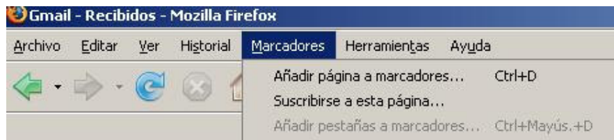
Ilustración 2. Marcadores en Mozilla Firefox