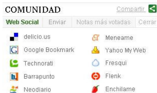
Ilustración 7. Iconos de agregación (Infobae)