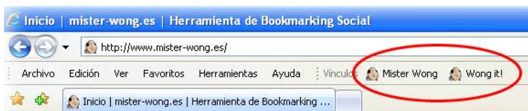
Ilustración 4. Bookmarklets de Mister Wong

b) Barras de herramientas personalizadas, que instalamos en la barra de nuestro navegador. No sólo nos permiten agregar la página actual a nuestros marcadores sociales, sino que traen funcionalidades añadidas, como ir a nuestra lista, ver nuestros favoritos, ver los favoritos de nuestros amigos / contactos, realizar búsquedas generales, por etiquetas o en nuestros favoritos, etc.