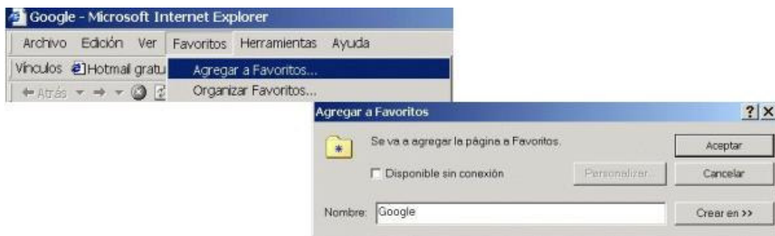
Ilustración 1. Favoritos en Internet Explorer

Nos permiten guardar la página actual del enlace seleccionado que estamos visualizando en nuestro navegador. No requiere de registro previo en ningún servicio de bookmarking. Es muy sencillo de utilizar; pero como contrapartida, sólo tendremos acceso a nuestra lista desde la máquina donde guardamos los favoritos.