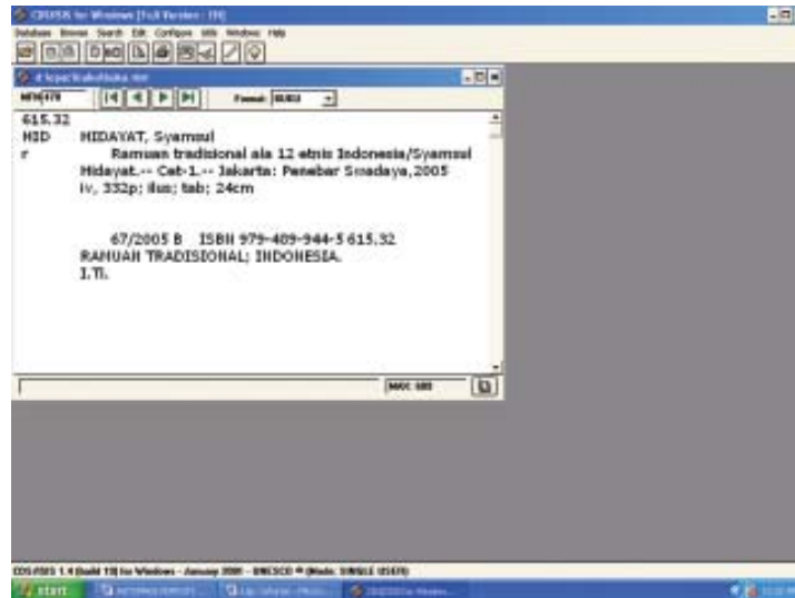
Gambar 1. Salah satu tampilan katalog elektronik buku.

tugas atau operator dapat memasukkan data saat pengguna sedang mencari dan memanfaatkan data tersebut melalui komputer ( workstation ). Contoh beberapa tampilan bibliografis dan hasil penelusuran informasi dengan menggunakan WINISIS disajikan pada Gambar 1 dan 2.