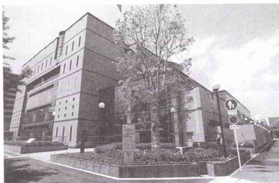
Biblioteca Pública Central del Municipio de Osaka.