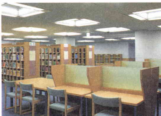
Hemeroteca. Sección de lectura.