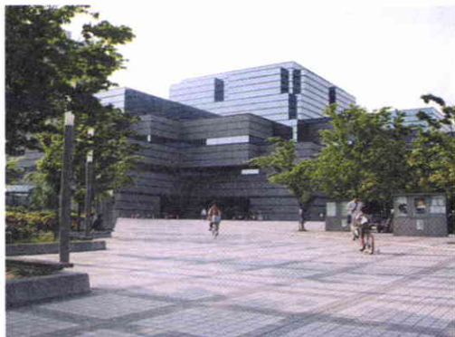
Fachada del edificio, cuya arquitectura exterior tiene la forma de libros apilados.