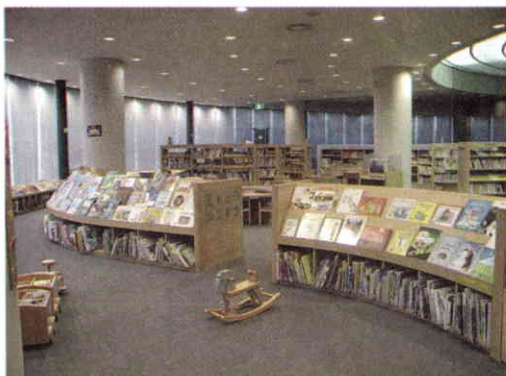
1er. piso, sección infantil.