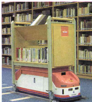
Vehículo de guiado automático. Se programa para desplazarse en horarios y lugares predeterminados.