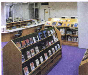
Sección de multimedia y material audiovisual.