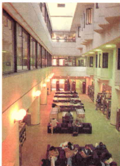
Biblioteca de la Universidad de Tsukuba - Hemeroteca.