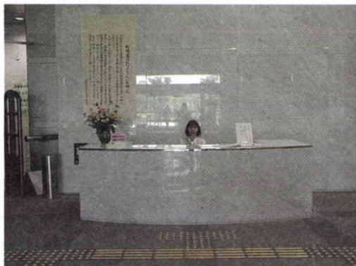
Entrada principal. Se puede apreciar en el piso bloques de señalización para invidentes.