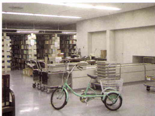
Depósito de la biblioteca. Triciclo utilizado para el almacenamiento de los libros. Atrás se aprecia el sistema automático de distribución de libros.