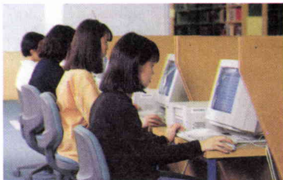
Usuarios en la sección de referencia.