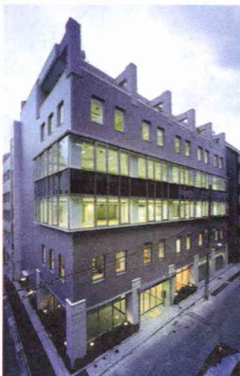
Local de la Asociación de Bibliotecas de Japón.