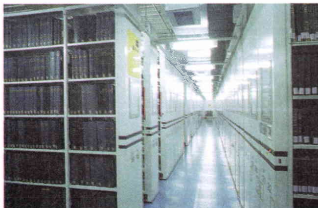
Sección de estantería cerrada con muebles corredizos automáticos.