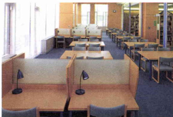
Sala de estudios.