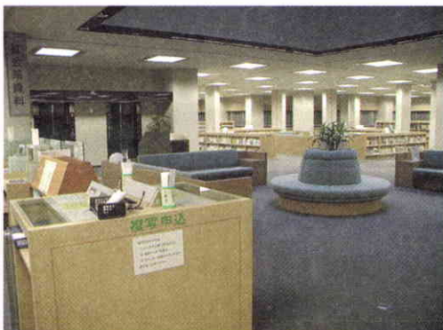
1er. piso, sección de lectura.