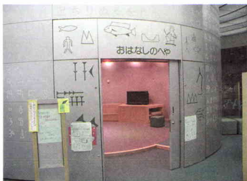
Entrada a la sala de cuentos ubicada en el centro de la sección infantil.