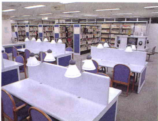
Sección Asia de la Biblioteca de Japan Foundation.