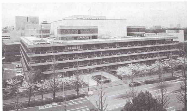
Biblioteca de la Dieta.