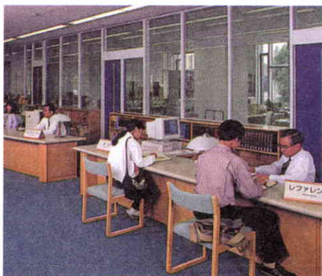
Sección de referencia atendida por especialistas.