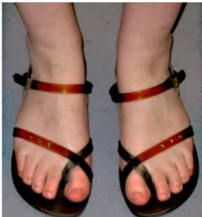
Gabriele, Fachhochschulbibliothek: An heißen Sommertagen ist auch in der Bibliothek Freiheit für die Zehen angesagt.