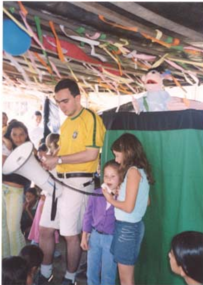
Foto 3. Docente del grupo de trabajo en una de las actividades de animación

de manera positiva de manera que ellos puedan replantear esos sentimientos en la nueva situación que enfrentan (resiliencia).