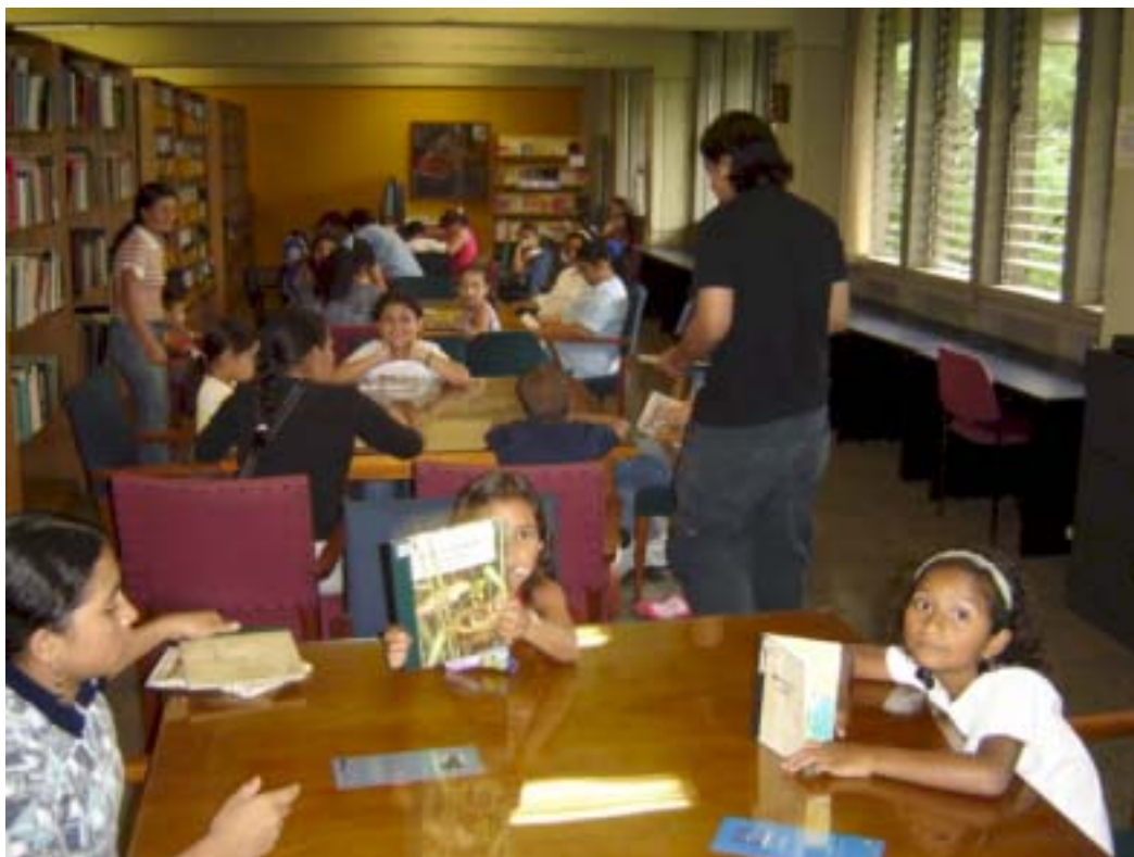
Foto 6. Niños y padres asistentes a una actividad en la Biblioteca de la Escuela Interamericana de Bibliotecología como actividad especial de mitad de año en junio de 2005