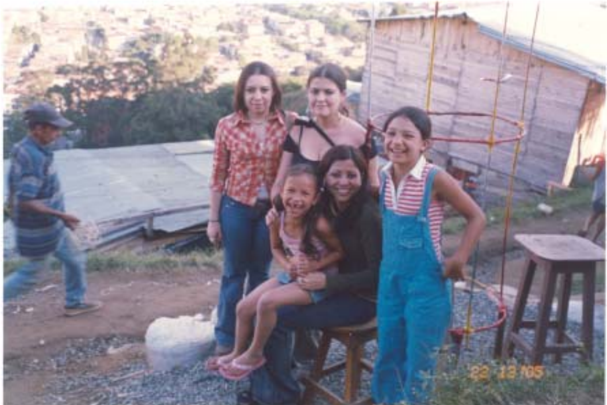
Foto 2. Integrantes del grupo en la última actividad del año 2005