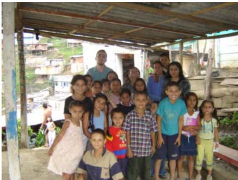
Foto 4. Niños asistentes a las actividades de animación en la Bibliocaseta “Mi pequeño Saltamontes”

trabajo y compromiso, sirva para la creación de proyectos, de servicios, similares que apoyen a comunidades marginadas.