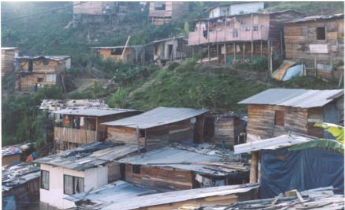
Foto 1. Visión general del Alto de la Virgen y sus tipos de vivienda

Sin embargo, como ya se indicó, debido a que este es un asentamiento subnormal, el municipio y corregimiento no pueden avalarlo, por lo tanto, esta comunidad no tiene opción de contar con servicios públicos legales y de calidad, ni realizar construcciones en ladrillo y demás, por lo cual el 98% de las edificaciones son en tablas o latas y el 80% de las vías de acceso son en arena.