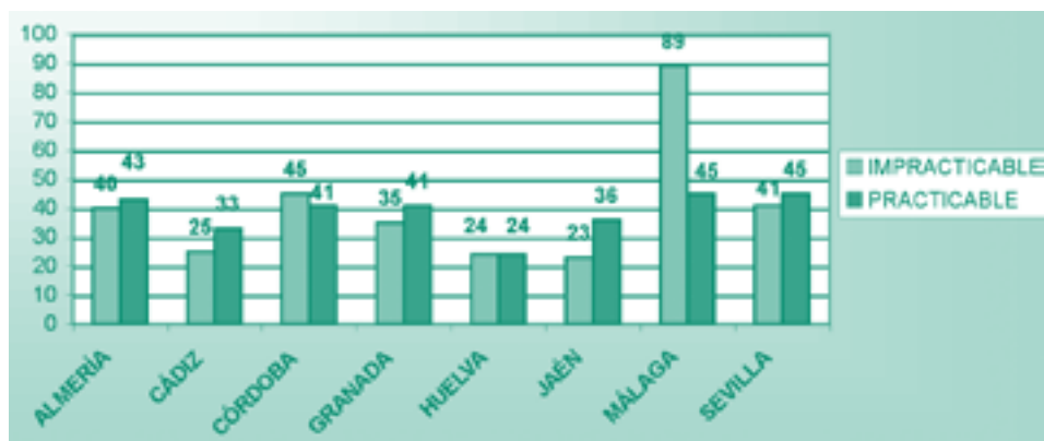
FIGURA 2 ¿SON ITINERARIOS PRACTICABLES PARA PERSONAS CON MOVILIDAD REDUCIDA EL ACCESO A LA BIBLIOTECA Y A LA TOTALIDAD DE SUS ÁREAS Y RECINTOS?