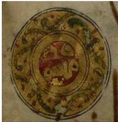
Marca en p. 3, margen externo, en esquina superior izquierda