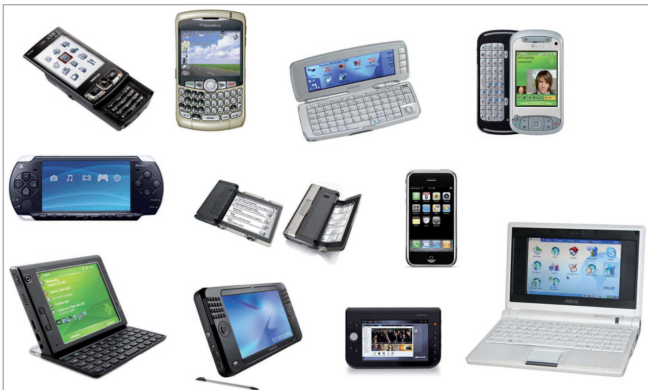
Diferentes tipos de dispositivos móviles

El lanzamiento del lector-e Kindle de Amazon ha abierto las posibilidades de mercado para un nuevo tipo de dispositivo, el libro electrónico, cuya finalidad última es la lectura de textos. Aunque son varios los que disponen de conexión vía wifi, como el iRex Iliad de Philips , FLEPia de Fujitsu , el Kindle de Amazon o Readius ( Monteoliva; Pérez-Ortiz; Repiso, 2008 ), su única finalidad suele ser la descarga de libros, la consulta de determinadas páginas o la actualización de noticias mediante RSS, y no la navegación, aunque no cabe descartar que ésta sea una de las opciones que se hagan realidad en el futuro, en la línea marcada por el pionero Readius , el teléfono lector de documentos desplegable.