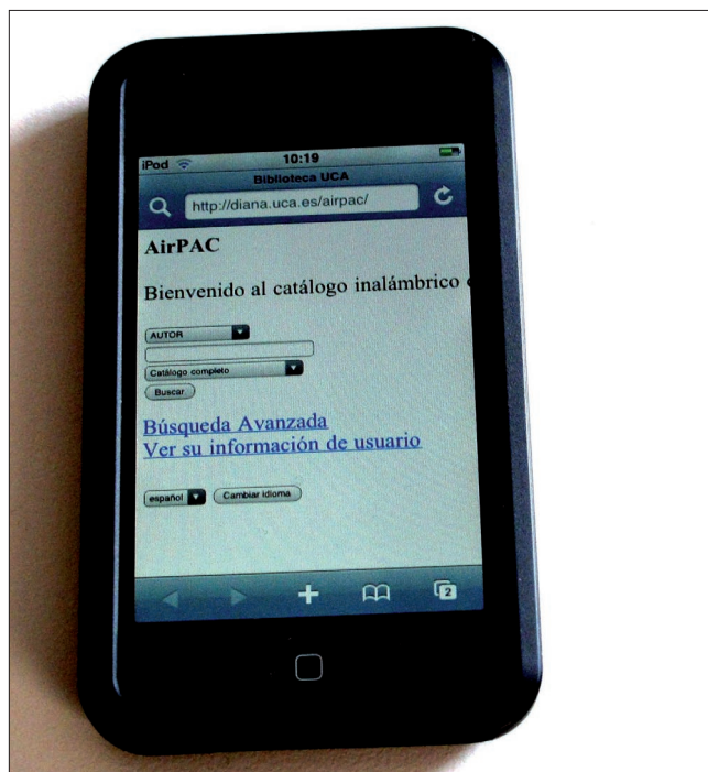
Catálogo AirPAC de la Universidad de Cádiz

http://biblioteca.uca.es/diana/Airpac.asp