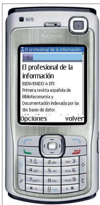
El Profesional de la Información

La existencia de una gran variedad de aparatos en el mercado puede llevarnos a cuestionarnos para qué tipo optimizar nuestro sitio web. Sin duda al-