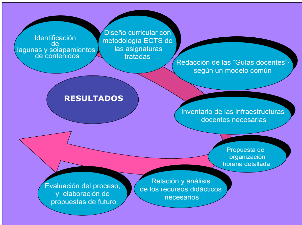
Fig. 3: Principales resultados