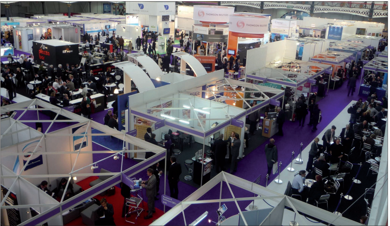
Vista parcial de la feria de la Online Conference. Las zonas oscuras, que ahora son zona de cafetería, eran ocupadas antaño por stands.

a las revistas científicas españolas ( Arce ), el repositorio Recolecta , y el proyecto Curriculum Vitae Normalizado (CVN) ;