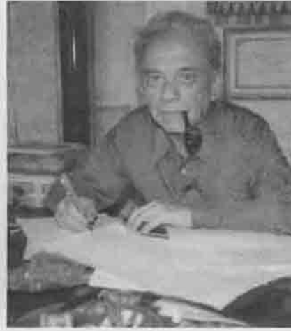
Daha önceleri Ulusal Bilgi Merkezi (UBİM) olarak tanınan Cahit Arf Bilgi Merkezi'nin adı, 26 Aralık 1997'de kaybettüğümüz ünlü matematikçi Cahit Arf'ın adına yeniden belirlenmiştir.

ULAKBİM tıp, mühendislik, tarım gibi alanlarda araştırmacıların gereksi-