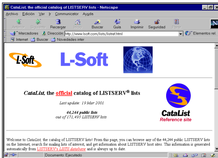
Figura 3. CataList

Tile-net/list es un directorio que reúne las listas de distribución gestionadas por distintos gestores existentes en Internet (LISTSERV, MAJORDOMO, LISTPROC, etc). En su base de datos se pueden seleccionar listas haciendo uso de un índice por nombres, dominios o descripción. También es posible agregar nuevas listas.