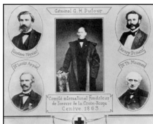
Comisión llamada "de los Cinco"

En 1859 el suizo Henry Dunant, presenció, tras la sangrienta Batalla de Solferino, donde se enfrentaban las tropas de Napoleón III y las austriacas de Francisco José, cómo los soldados heridos quedaban abandonados y sin ningún tipo de ayuda en el campo de batalla. En 1863, Dunant y cuatro personas más -hoy llamados 'el comité de los cinco' - formaron el 'Comité Internacional de Socorro a los Militares Heridos' , organización que elaboró la Convención de Ginebra 2 (1864) que pretendía proteger a los militares heridos de guerra así como a civiles afectados por las batallas.