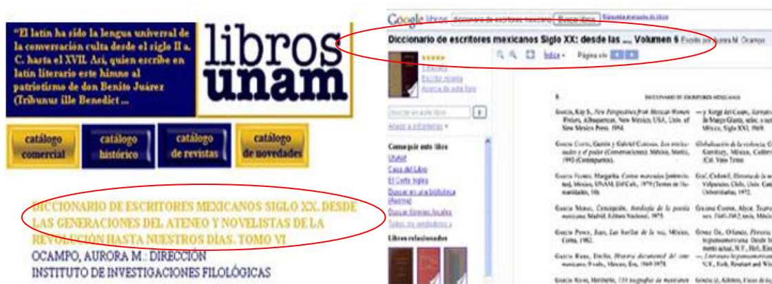
Figura 3. Diccionario de escritores mexicanos... Está en ambos sitios ( Google libros y libros unam ) pero no hay un elemento en el registro del libro que relacione ambos sitios web. Consultado el 14 de abril. 2010

En el caso aquí abordado, conviene subrayar dos puntos: