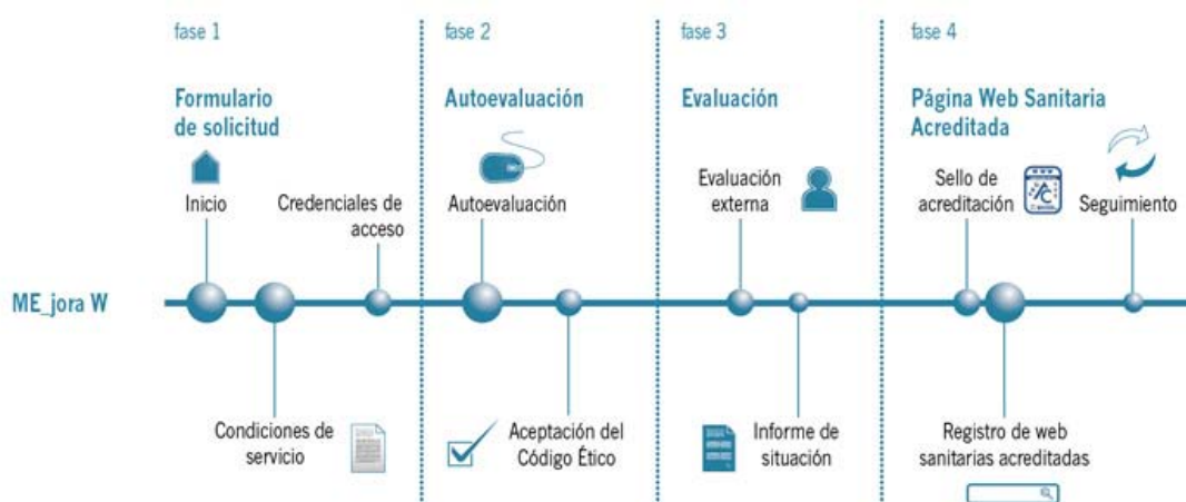
Figura 1. Fases del proceso del Programa de Acreditación de Páginas Web Sanitarias

Una vez obtenida la Acreditación, comienza una fase de Seguimiento para verificar el mantenimiento en el tiempo del cumplimiento de los estándares y evidencias de este programa.