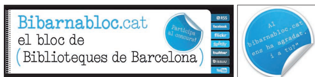
Elementos de marketing y promoción de Bibarnabloc

Se han repartido 50.000 puntos de libro promocionando el blog y animando a los lectores a participar. Se han diseñado promociones para publicarlo en las pantallas de plasma de algunas bibliotecas. Todos los centros disponen de un “espacio Bibarnabloc ” donde exponen los documentos recomendados en el blog y los carteles del concurso. Los documentos reseñados incorporan unas pegatinas que los identifican como documentos recomendados en Bibarnabloc con la frase: En Bibarnabloc.cat nos ha gustado, ¿y a ti? , de manera que todos los lectores sepan que se trata de un documento recomendado.