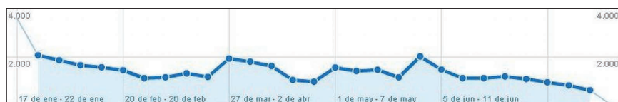
Actividad del blog

Se realiza una valoración tanto cuantitativa, con un software de análisis web, como cualitativa, a partir de los comentarios online de los lectores y las opiniones de los ganadores de los concursos. El programa para examinar técnicamente el blog es Google Analytics , con el que se ha monitorizado la actividad y se miden acciones como el uso del sitio (visitas, páginas vistas, visitas nuevas, promedio de tiempo en el sitio, etc.), e información concreta de las visitas y de las fuentes de tráfico.