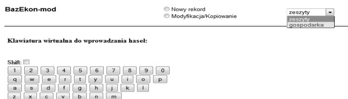
Rys. 3. BazEkon – kolekcje

Początkowo informacje o zagadnieniach ekonomicznych były zawarte w dwóch bazach: Gospodarka i Nauki Społeczne. Pierwsza z nich była uzupełniana przez pracowników Oddziału Informacji Naukowej i zawierała informacje o zawartości czasopism. Za drugą odpowiadał Oddział Czytelní, rozpisując w niej zawartość naukowych serii wydawniczych. W czerwcu 2010 r. doszło do fuzji, w której wyniku powstał BazEkon. Nadal został zachowany wewnętrzny podział bazy na dwie kolekcje: „Gospodarka” i „Zeszyty”.