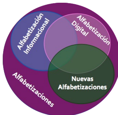
Figura 3: Articulación de los conceptos relacionados a las alfabetizaciones

Relacionadas con la alfabetización informacional y el uso, acceso y evaluación de la información. Son fortalezas que deben tener los bibliotecarios, quienes deben poseer competencias en cuanto al acceso, evaluación y uso de la información, y además saber transmitir estas competencias a otros, ya que los bibliotecarios tienen un importante papel que desempeñar en la alfabetización informacional. Recientemente, los bibliotecarios se han encontrado en el papel de formadores e incluso en el de educadores, muchos incluso tomando cursos, instruyéndose informalmente o investigando sobre temas de educación. El papel del bibliotecario como formador es el bibliotecario que busca enseñar a sus usuarios y por qué no, a las comunidades y sociedad en general sobre cómo utilizar la información de una manera efectiva. Formar usuarios con estas competencias es sumamente importante ya que ellos son los grandes creadores de contenido en esta era de las redes sociales. Para la sociedad en general, y en especial la latinoamericana, la gran importancia de la alfabetización informacional está en ayudar a las sociedades a saber evaluar y usar la información de manera correcta, con la esperanza que puedan tomar las mejores decisiones al ejercer sus deberes y derechos ciudadanos.