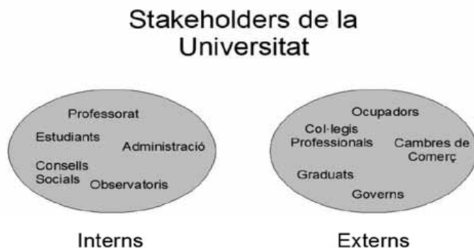
Figura 1. Esquema dels principals stakeholders de les universitats

tenir cap relació orgànica amb l'organització, tal com es mostra a la figura 1.