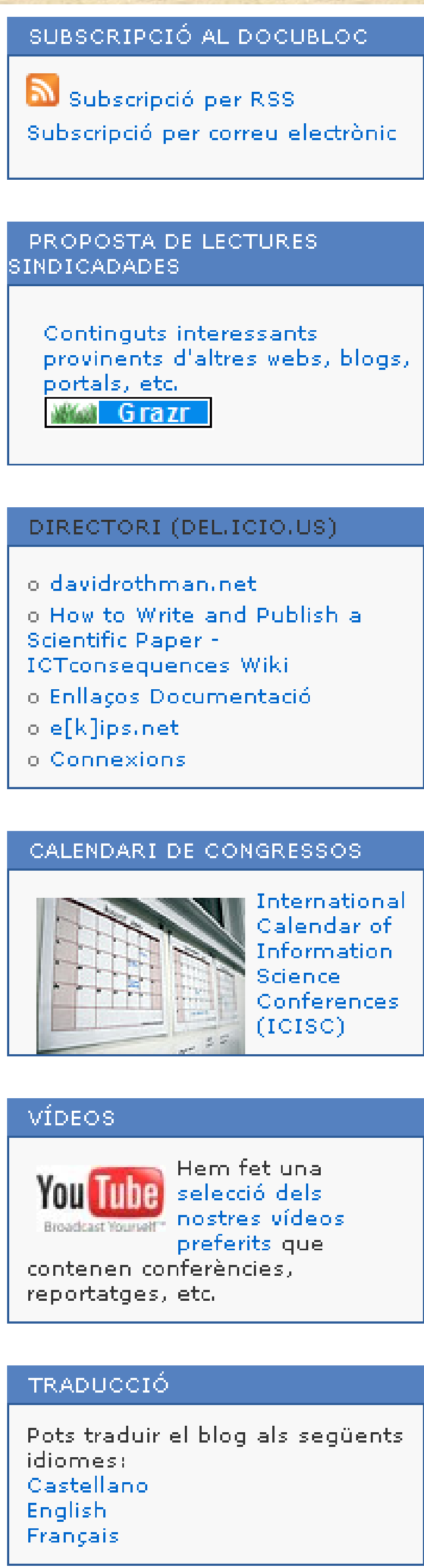
Figura 2. Eines de Docublog

Figura 3. Tots els continguts del blog estan llicenciats en la llicència de Creative Commons "Reconeixement-No comercial-Compartir amb la mateixa llicència 2.5 Espanya"