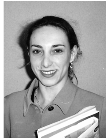
Cristina García Testal

García Testal, Cristina. "Pagos, micropagos e internet". En: El profesional de la información , 2000, marzo, v. 9, n. 3, pp 11-19.