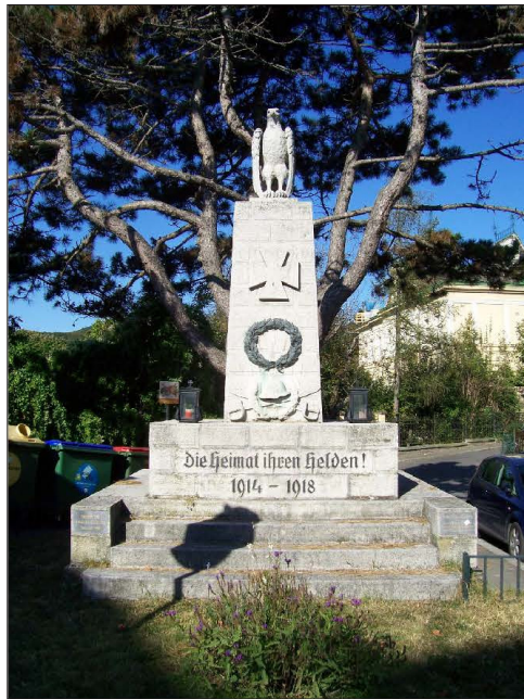
Abb. 2: Kriegerdenkmal nach dem ersten Weltkrieg in Wien-Weidlingau

excitement. It seemed as if every man, woman, and child had been groping for a freedom found only in war – a freedom from the uninspiring and self-absorbed dissensions of domestic life.“ Und was für eine Erlösung! Geht man davon aus, dass zum Beispiel die österreichischen Aufmarschpläne zumindest Russland bekannt waren – die Affäre um Oberst Redl und die darauf folgenden Vertuschungsversuche durch korrupte österreichische Generalstäbler, allen voran der Chef des k.u.k. Generalstabes, Franz Conrad von Hötzendorf, ist legendär – kam der Kriegseintritt, zumindest für einfache Soldaten, einem Selbstmordversuch gleich. Die überall noch vorhandenen Kriegerdenkmäler (siehe zum Beispiel Abbildung 2) zeugen mit verblassendem Pathos von dieser millionenfachen menschlichen Tragödie, die bereits wieder vergessen ist.