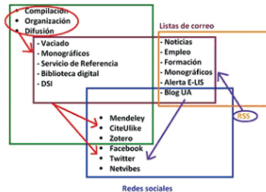
Interacción entre los canales utilizados para retroalimentar y difundir servicios