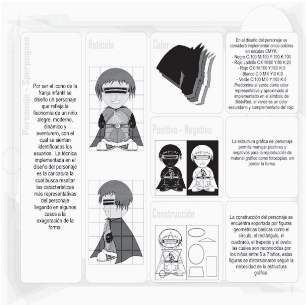
Figura 3. Personajes