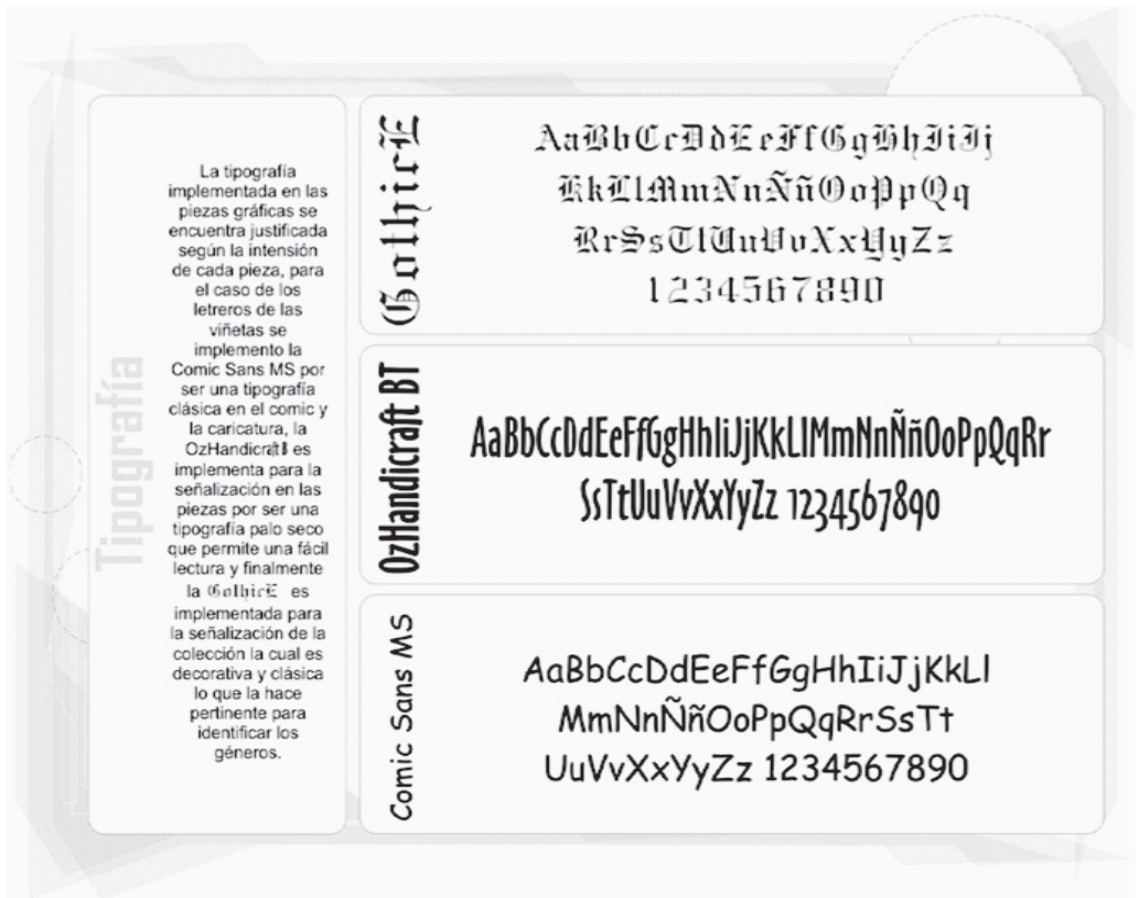
Figura 4. Tipografía