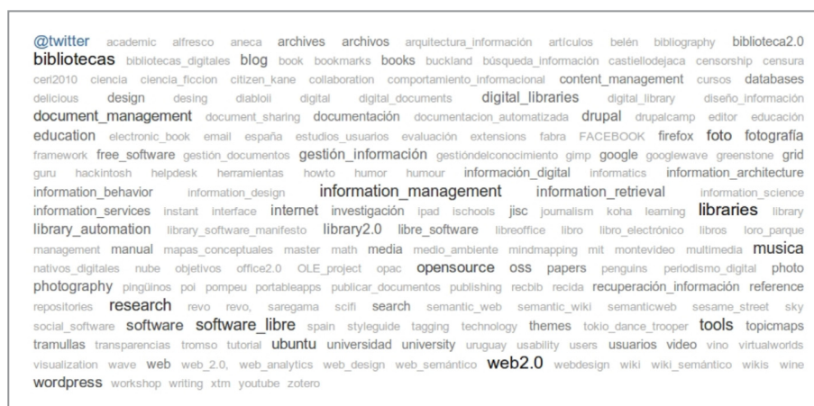
FIGURA 3. NUBE DE ETIQUETAS ( TAG CLOUD ) EN DELICIOUS

Una especialización destacada de los marcadores sociales son los marcadores de referencias bibliográficas, en ocasiones denominados gestores o marcadores bibliográficos sociales. Estas herramientas ofrecen el mismo enfoque de captura, etiquetado y colaboración, pero su objeto de trabajo principal son referencias bibliográficas. Servicios como CiteULike , Connotea , Mendeley , 2Collab o BibSonomy entran dentro de esta categoría.