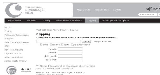
Figura 4. Interface de busca disponível para toda a comunidade interna e externa à universidade.

Figura 4: interface de busca (de acesso livre), a qual está disponível para toda a comunidade interna e externa à universidade que desejam realizar a busca e a recuperação da informação jornalística sobre a UFSCar e referente a ela.