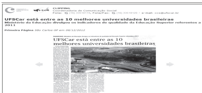
Figura 2. Clipping : UFSCar está entre as 10 melhores universidades brasileiras.

O acervo de clippings da CCS-UFSCar é formado por notícias, notas e fotografias publicadas em meios de comunicação impressos e eletrônicos (jornais, revistas, sites, etc.) referentes a assuntos sobre a Universidade e de interesse da comunidade acadêmica (Figura 2). O processo manual de elaboração de clipping iniciou-se em 1998 e a partir de 2008 foi totalmente automatizado gerando os clippings eletrônicos, mais conhecidos por e-clippings ( electronic clippings ).