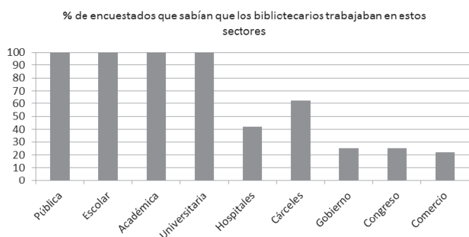
Figura 1. Conocimiento sobre tipologías bibliotecarias y otros sectores relacionados con las bibliotecas.

Pregunta: ¿Sabe usted en qué trabajan los bibliotecarios? (por favor marque todas las casillas en las que usted sepa que trabaja un bibliotecario).