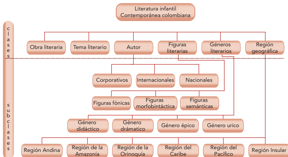
Figura 2. Definición de clases y jerarquía de clases: herencia de conceptos

En la figura 2, se observan cuáles son las clases que se definieron para utilizar dentro de la estructura ontológica, se señalan las subclases correspondientes, a fin de identificar la jerarquía de estas y cuáles serían las subclases que heredarán sus características.