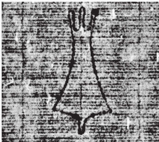
Klosterneuburg, Stiftsbibl., Cod. 269, fol. 144 (um 1391/93)