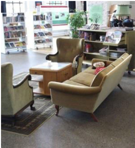
Garaget v Malmö slouží jako obývací město

Měla by knihovna být spíše klasickým funkčním prostorem, kde vládne klid a mír, nebo progresivní institucí s inovativními službami a neobvyklým fondem? Odpověď na tuto otázku nelze všeobecně uplatnit na všechny veřejné knihovny, neboť při navrhování interiérů knihoven je vždy klíčové myslet na uživatele dané knihovny a reflektovat jejich potřeby a požadavky.