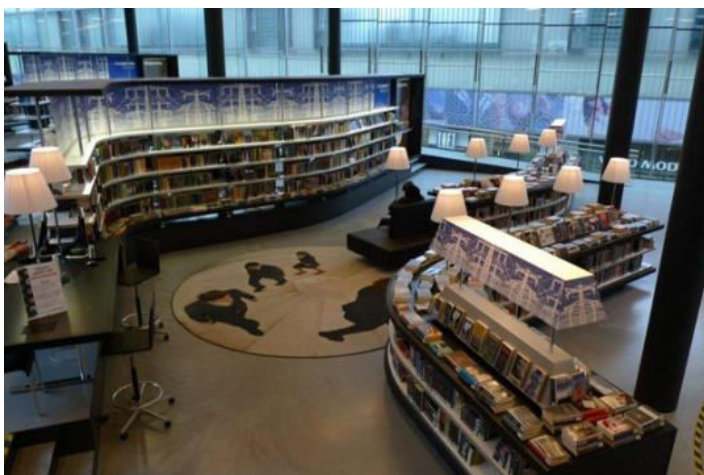
Oddělení Napětí a tematicky laděný interiér v Nově knihovně v Almere

Spojovacím prvkem prostor knihovny je interiérový design od grafického studia Thonik, který zároveň graficky vyjadřuje tematické zaměření jednotlivých „obchodů“ (např. grafika ve stylu stožárů vysokého napětí signalizuje oddělení „Napětí“). Prosklená budova nové knihovny se nachází přímo v centru města. Trojúhelníkový tvar stavby vybíhá rovnou doprostřed náměstí a doslova vybízí k návštěvě během procházky městem.