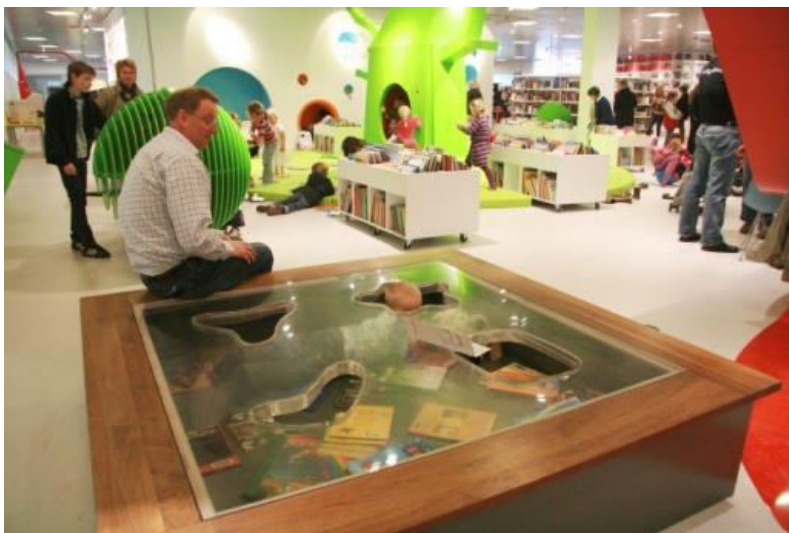
Netradiční dětské oddělení v Městské knihovně v Hjørringu

Další cíl z druhého tematického okruhu Koncepce se snaží dosáhnout zlepšení čtenářské gramotnosti a schopnosti vyhodnocovat informace, zvýšit počet dětí, které využívají knihovny, a zvýšit společenskou prestiž četby. Modelový program sice přímo neřeší otázku zvýšení čtenářské gramotnosti, zato prostřednictvím návrhu prostorů dětského oddělení může přispět k nárůstu návštěvnosti dětských čtenářů ve veřejných knihovnách .