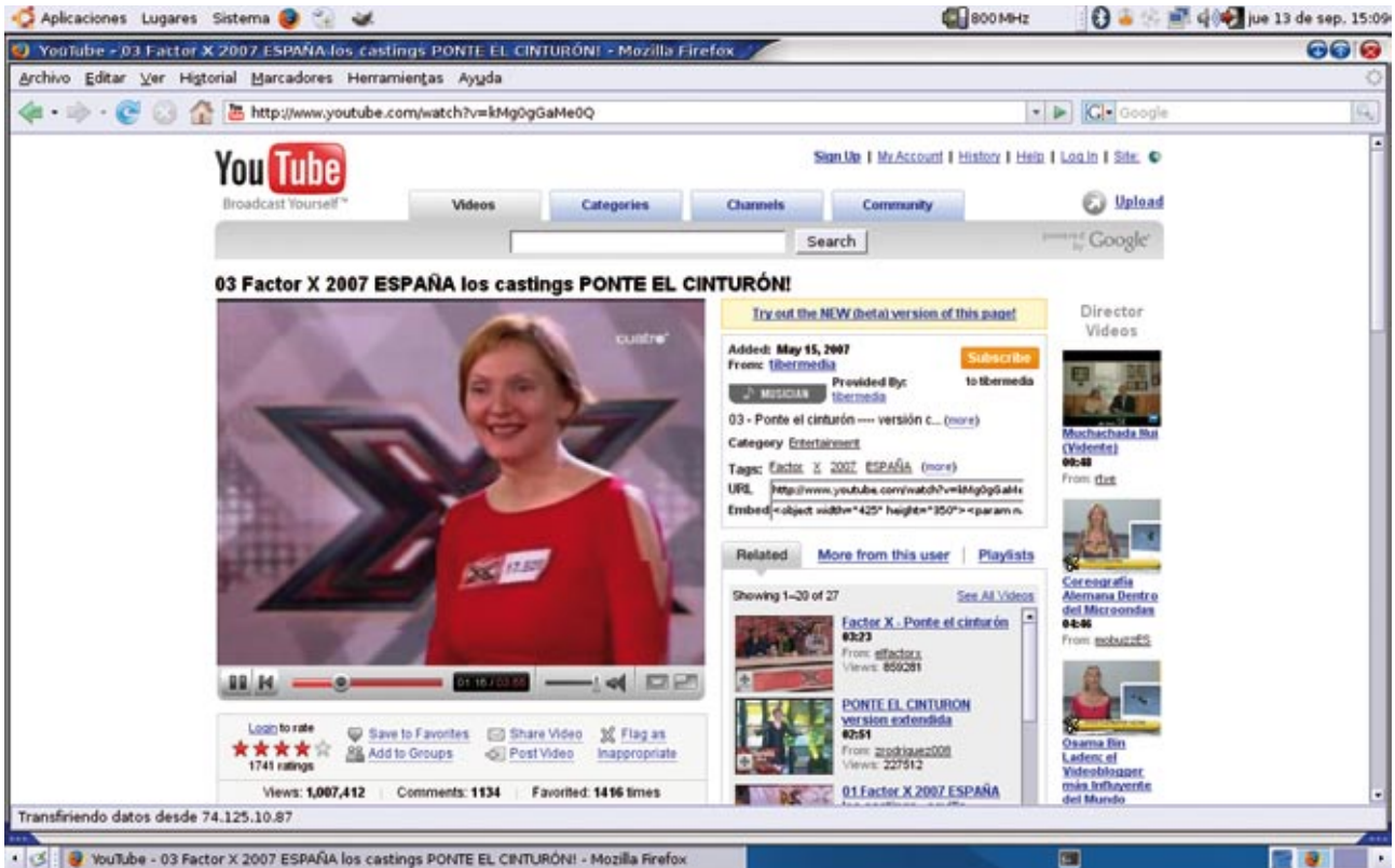
Fig. 1. Youtube ( http://www.youtube.com )

internet. No sólo eso: es de esperar que gracias a estos servicios acabe superándose la regla del 1% (teoría según la cual por cada individuo que crea o escribe algo en internet hay 99 que sólo leen).