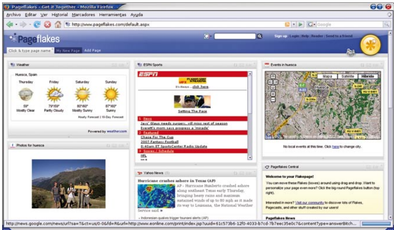
Fig. 2. Pageflakes ( http://www.pageflakes.com )

tarda un usuario en aburrirse de las prestaciones de Pageflakes? Por el momento, el factor básico de supervivencia es la creación de redes sociales de usuarios, que aseguren la perduración del interés del individuo y, por ende, su pertenencia a un grupo. Abordar éstas en el entorno digital supera ampliamente el objetivo de estos párrafos. Resulta que una cuestión tecnológica, como es la gestión de contenidos, se ha transformado en una cuestión social. Ya decía MacLuhan aquello de la traslación de la cultura cuando se interiorizaban las tecnologías.