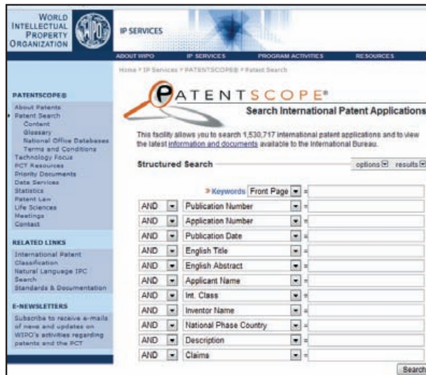
Fig. 1 – Biblioteca Digital do Patent Scope da OMPI ( http://www.wipo.int/pctdb/en )

Na Patent Scope da OMPI estão os documentos de Patente pedidos via Tratado PCT ( Patent Cooperation Treaty ) que possibilita que um único pedido seja válido nos cerca de 130 países que o constituem. A partir de um único ponto temos acesso a cerca de 1,5 milhões de Patentes internacionais, desde a primeira publicação na sua origem em 1978.