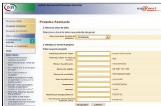
Fig. 2 – Biblioteca Digital de Patentes do Esp@cenet (em Português) ( http://pt.espacenet.com )

Aquela que talvez seja mais interessante para as empresas portuguesas, uma vez que se encontra em português, o que pode facilitar a sua consulta e utilização é a Esp@cenet . A funcionar desde 1998, contém as Patentes concedidas em Portugal e em todos os países que assinaram o Tratado Europeu de Patentes via EPO. Elaborada com base na anterior, e uma das pioneiras BD de Patentes, a INPADOC, permite o acesso a mais de 60 milhões de documentos de Patente, provenientes de mais de 75 países.