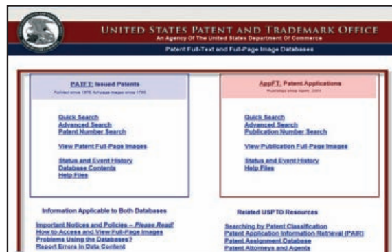
Fig. 3 – Biblioteca Digital de Patentes do USPTO ( http://www.uspto.gov )

Passamos agora ao ‘gigante americano’, a BD do USPTO . Aqui é possível pesquisar não só os documentos de Patentes concedidas como também das que se encontram em análise. A funcionar desde 1976, possui informação desde 1790. Desde 2001 permite pesquisar os documentos ainda antes da Patente ser concedida. A sua BD é seguramente a maior, considerando um país individualmente.