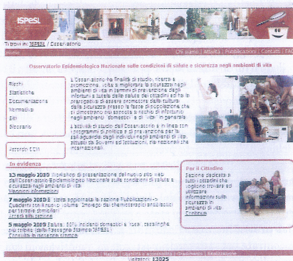
La homepage del nuovo portale

on-line. A piè di pagina nella homepage gli utenti hanno la possibilità di compilare un questionario di gradimento e fornire osservazioni, commenti, suggerimenti. Il nuovo Portale dell'Osservatorio si presenta quindi come uno strumento dinamico e in continuo aggiornamento, da una parte a vantaggio degli operatori della prevenzione, dall'altra pensato per tutta la popolazione, in particolare le fasce maggiormente a rischio (donne, anziani e bambini/ragazzi). Il Repository Il Repository dei documenti è il bacino, alimentato siste-