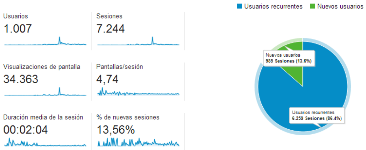
Ilustración 4: estadísticas generales de la app 2014 - Q1

descubrimiento de la app. Lo importante de dicho dato será ver si con el paso del tiempo se mantiene o no en esa línea, de forma que nos vaya dando señales del interés que despierta en los usuarios.