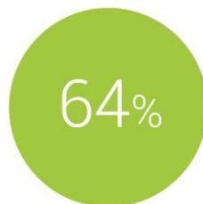
Ilustración 1: Uso de Internet móvil y principales usos de los smartphones (Elaboración propia a partir de diferentes fuentes)