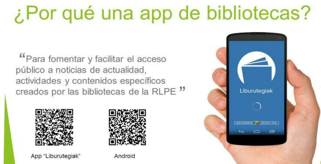
Ilustración 3: Cartel promocional de la app Liburutegiak para las bibliotecas

Otra de las oportunidades que nos ofrece el marketing online es la utilización de códigos QR. Para esta acción creamos un cartel para repartir por todas las bibliotecas de la Red y distribuirlo al mismo tiempo por las redes sociales. Se incluye una pregunta clave: ¿Por qué una app de bibliotecas? y se ofrece una respuesta adecuada que resume perfectamente el objetivo y la finalidad de la app. La imagen del smarthone ayuda a recordar y a asociarla con el logo, el lema y el color, distintivos básicos de la app que refuerza su capacidad de asociación y recuerdo. Los códigos QR permiten a su vez la descarga automática desde Android o a la web de promoción para que amplíe su información.