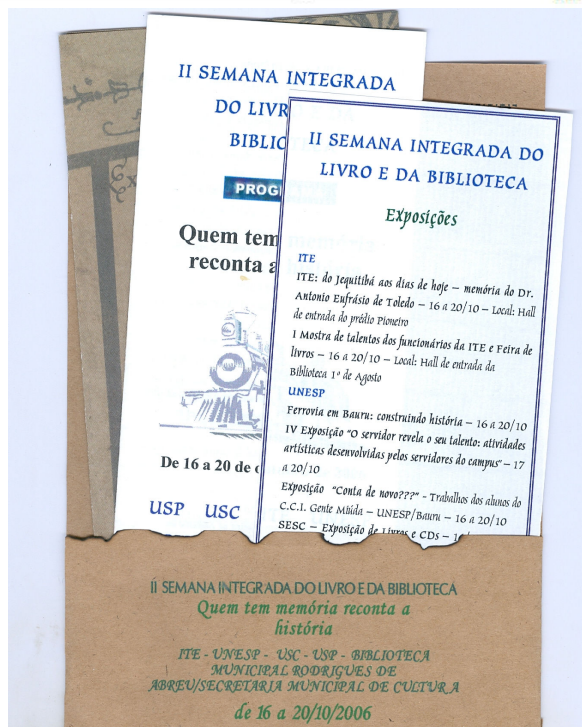
Figura 2 - Convite da II Semana Integrada do Livro e da Biblioteca