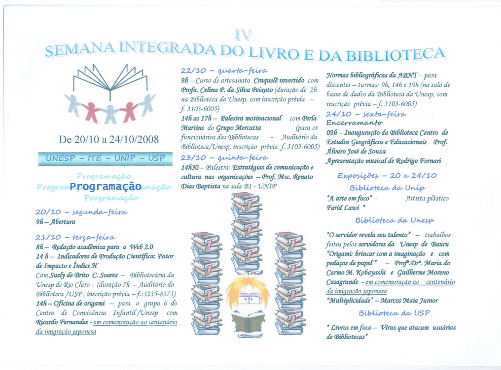
Figura 4 - Convite da IV Semana Integrada do Livro e da Biblioteca

Procurou-se concentração de esforços, pois as Bibliotecas costumavam trabalhar de forma isolada. Com a união do grupo e a troca de experiências esperava-se o fortalecimento da imagem das Bibliotecas.