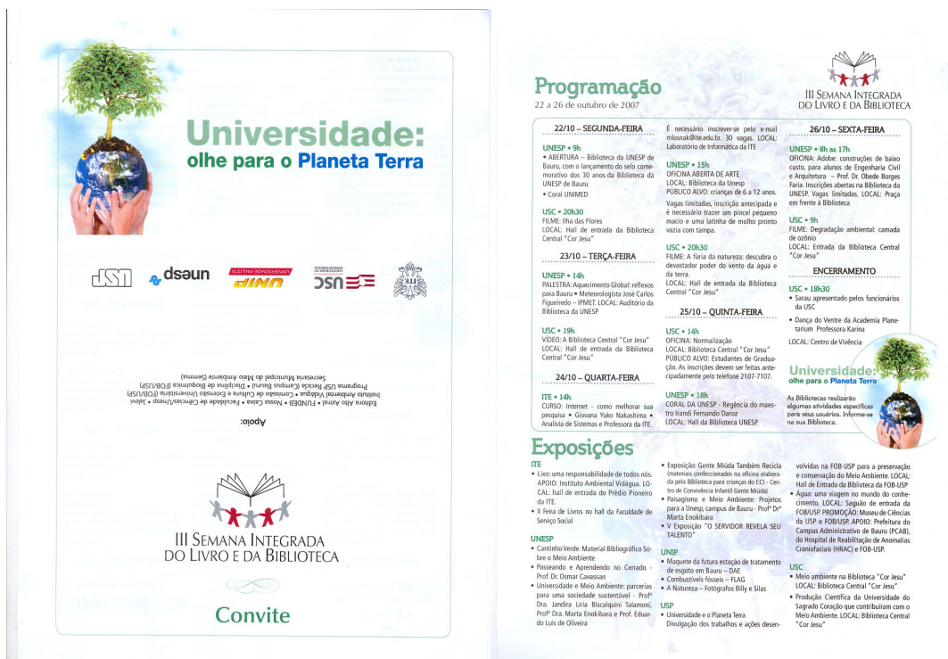
Figura 3 - Convite da III Semana Integrada do Livro e da Biblioteca (frente e verso)