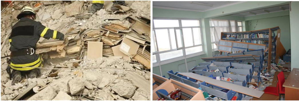
(Resim 1): Köln Arşiv Binasının çökmesi sonucu arşivlerde meydana gelen hasar 8 - solda- Van Yüzüncü Yıl Üniversitesi Ferit Melen Kütüphanesinde meydana gelen deprem hasarı- sağda. 9