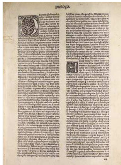
Gráfico 3. Edición de 1555 de las Siete Partidas, glosadas por Gregorio López. Edición a cargo de Andrea Portonaris, impresor real (Fuente: Fondo Reservado de la Biblioteca "Samuel Ramos", Facultad de Filosofía y Letras, UNAM).