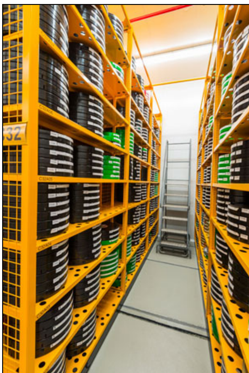
Figura 3. Dipòsits de conservació del 2CR de la Filmoteca de Catalunya

El 2CR presta atenció a la conservació dels suports fotoquímics i també digitals. Pel que fa als fotoquímics, el centre té àrees específiques per rebre'ls, inspeccionar-los, visionar-los i tractar-los, ja siguin negatius com positius, i uns sistemes de càmeres amb controls de temperatura, humitat i renovació d'aire, adaptades a les necessitats dels suports plàstics, ja siguin acetat de cel·lulosa, polièster o nitrat de cel·lulosa. Per primer cop, Catalunya té una institució preparada per evitar la pèrdua del patrimoni fílmic que tot canvi tecnològic comporta —en el pas del mut al sonor es va perdre el 80 % de la producció mundial anterior a 1930; a Catalunya arriba al 90 %.