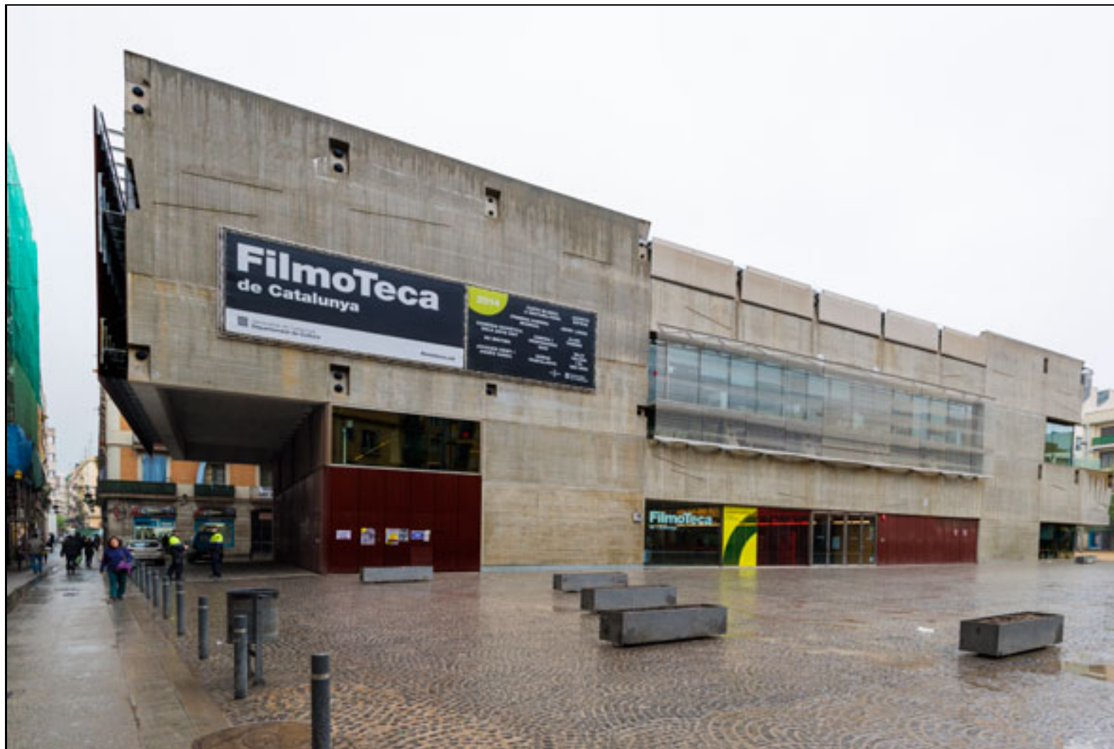
Figura 1. Seu de la Filmoteca de Catalunya a Barcelona

L'any 2012 l'impuls a la Filmoteca de Catalunya es completava amb un trasllat ambiciós de les antigues dependències a les dues noves seus: l'edifici del Raval, on conviuen oficines i dipòsits de preservació documental amb espais oberts al públic (sales de projecció, sala d'exposicions, biblioteca especialitzada), i l'edifici del Centre de Conservació i Restauració (2CR), al Parc Audiovisual de Catalunya ( http://www.parcaudiovisual.cat ), a Terrassa, construït i dissenyat per garantir la conservació del patrimoni fílmic, ja sigui analògic o digital.