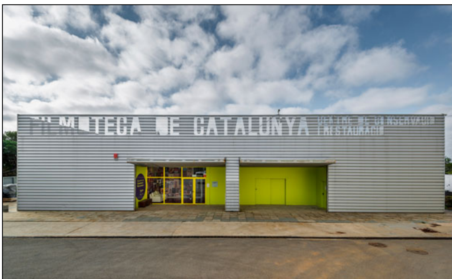
Figura 2. Seu del 2CR de la Filmoteca de Catalunya al Parc

Audiovisual de Catalunya (Terrassa)