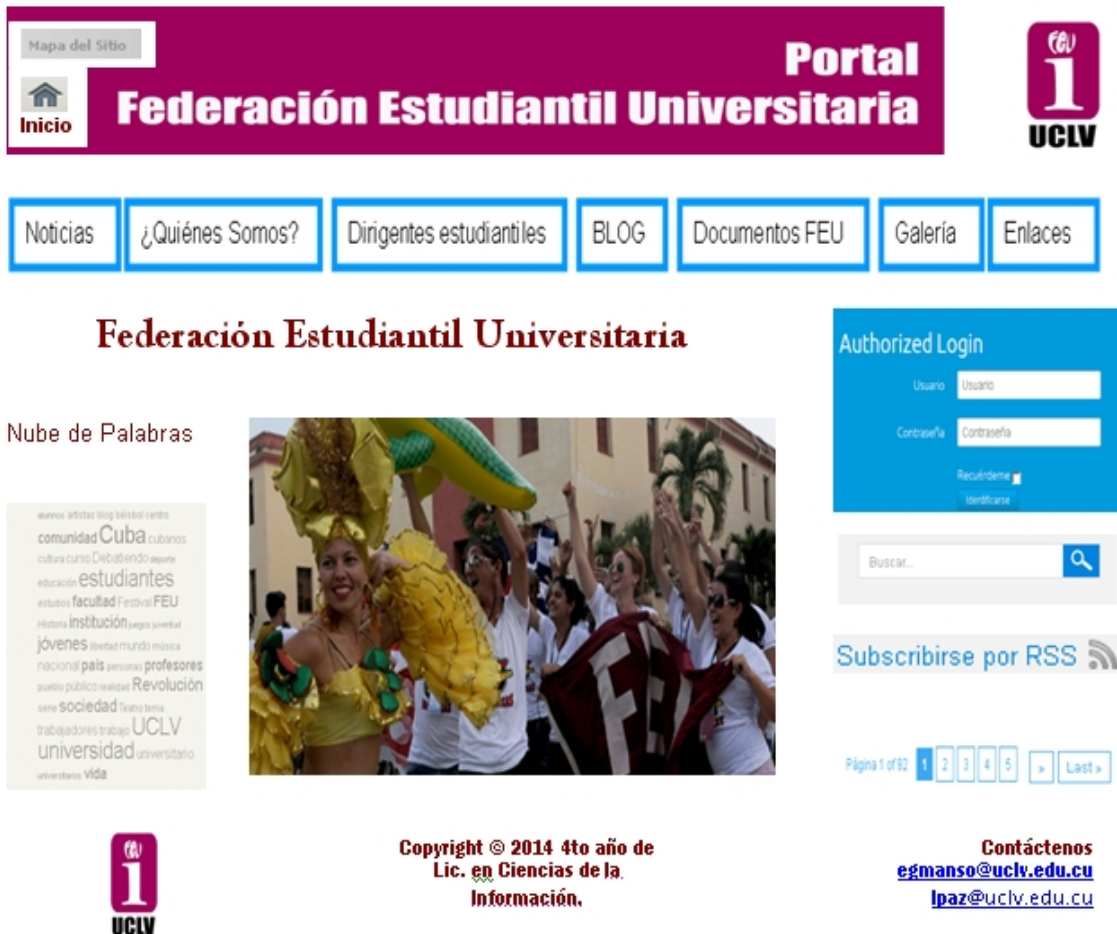
Imagen 1: Prototipo de la Página Primaria del sitio.

Para el sistema de etiquetado se definen las etiquetas: NOTICIAS, ¿QUIÉNES SOMOS?, DIRIGENTES ESTUDIANTILES, BLOG: NUESTRO CREDO, ENLACES DE INTERÉS, DOCUMENTOS FEU y GALERÍA. En el sistema de organización se elabora una taxonomía estructurando los contenidos por cada una de las etiquetas definidas. Para el sistema de navegación se estima ubicar migas de pan dinámicas, se establece un nivel máximo de tres clics para acceder a la información y se establecen los links del sitio, la navegación escogida para el diseño del sitio Web es la global y de telaraña. En el sistema de búsqueda se proponen varios metadatos para la localización de la información y se propone un cajón de búsqueda simple para facilitar la recuperación de información por parte de los usuarios proponiéndose los operadores booleanos (AND, OR, NOT) y los lógicos. Se plantea un prototipado para cada una de las páginas (primaria, secundarias y terciarias)