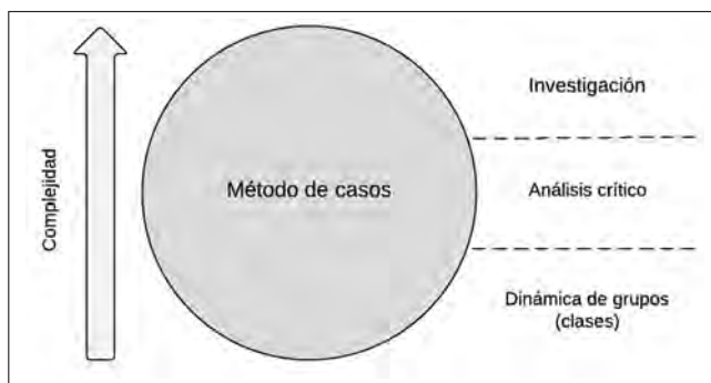
Gráfico 2. Validez pedagógica del método de casos

El método de casos y la investigación científica comparten elementos comunes, principalmente el intento general de presentar una situación del mundo real. Hay algunos procedimientos a seguir: los criterios para la selección de los sujetos de la investigación, el establecimiento de la cantidad de casos, la recopilación de la evidencia de la investigación y el análisis y la presentación de los hallazgos (Štrach & André, 2008).