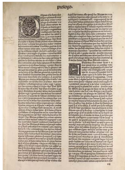
Gráfico 3. Edición de 1555 de las Siete Partidas, glosadas por Gregorio López. Edición a cargo de Andrea Portonaris, impresor real (Fuente: Fondo Reservado de la Biblioteca "Samuel Ramos", Facultad de Filosofía y Letras, UNAM).