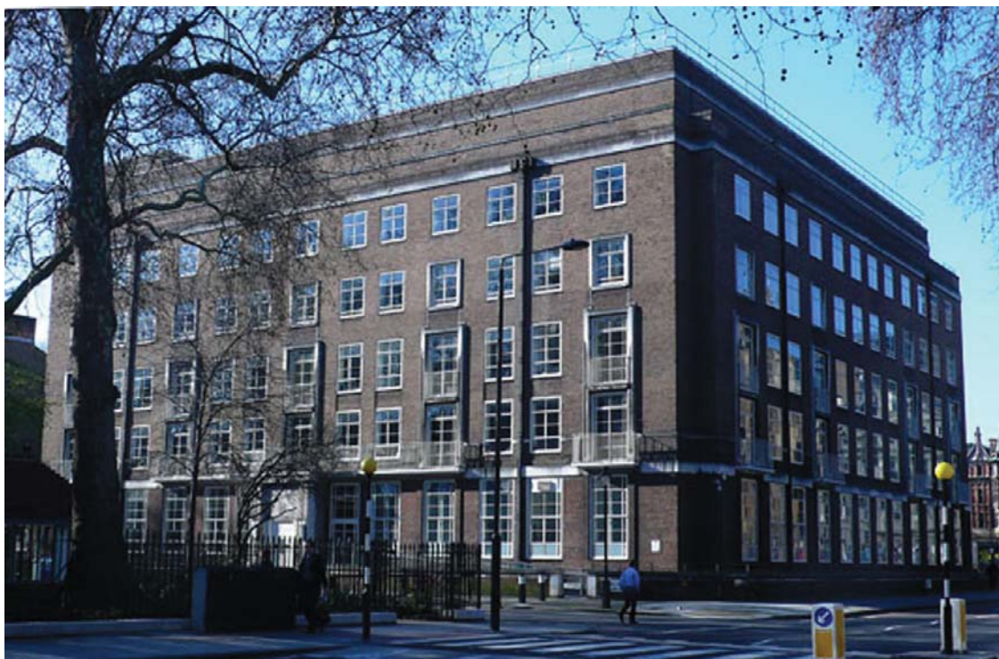
Sede da Warburg Library en Londres.

un campo de problemas. O camiño vai da astroloxía á astronomía, da alquimia á química, da maxia numérica ás matemáticas, da lectura de augurios no figado á anatomía. A disposición da biblioteca ofreceulle a oportunidade de elaborar a súa filosofía do simbolismo, que se basea nunha progresión da acción ritual á orientación mental; a expresión lingüística e as imaxes visuais proveñen das orixes da cultura humana.