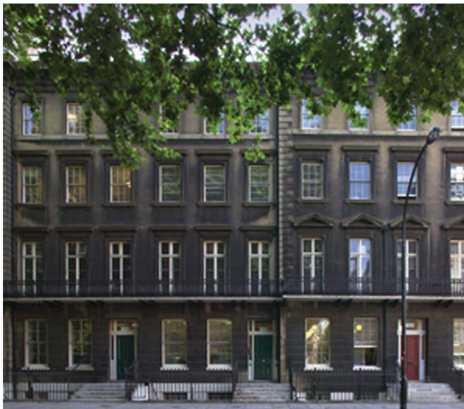
Detalle da entrada da Warburg Library en Londres.

Esta primacía é especialmente importante nun mundo como o noso, un mundo e un xeito de concibilo onde a imaxe supera á palabra, pois todo vén acompañado de iconas, emoticonas, símbolos, alegorías, carteis e todo tipo de signos lingüísticos. No terceiro andar chégase ao mundo da orientación, do